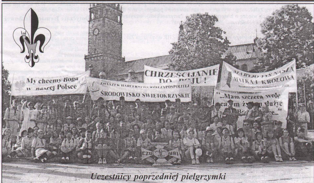
Uczestnicy poprzedniej pielgrzymki