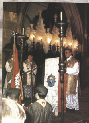
Msza św. w Katedrze Wawelskiej