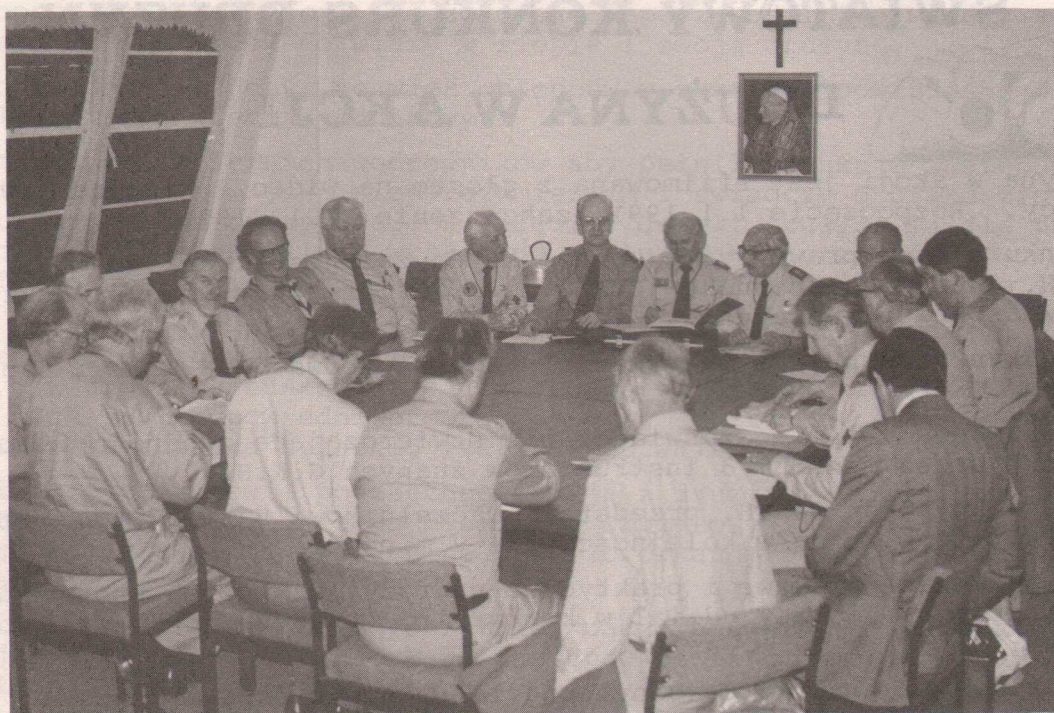
Główna Kwatera Harcerzy w Londynie, w czasie jednego ze spotkań

W harcerskiej metodzie pracy należy unikać nadmiernej poufałości lub surowości, morałów, "kazań" i górnolotnych pouczeń, nieprzemyślanych i gwałtownych decyzji, kar i faworyzowania. Należy nie zapominać o ambicjach jednostki /ambicja to zdrowy objaw/ i nie bagatelizować żadnych zdolności jednostki. Powinniśmy posiadać zdolność wnikania w ambicje młodzieży.