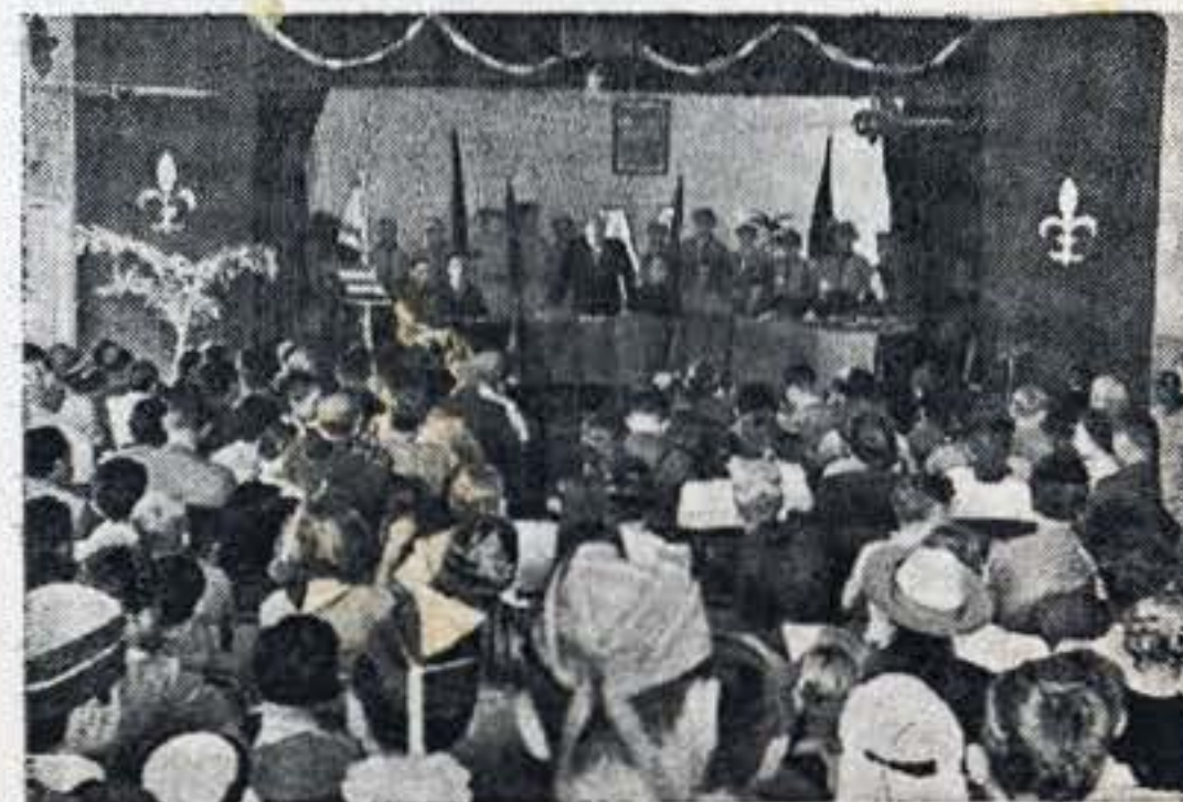
Przy wypełnionej po brzegi sali, w atmosferze harmonii i wzajemnego zrozumienia, odbywały się obrady Konferencji Harcerskiej.

As no doubt you are aware — discipline and obedience are necessary to a soldier as well as to a scout, as much as courage is to them.