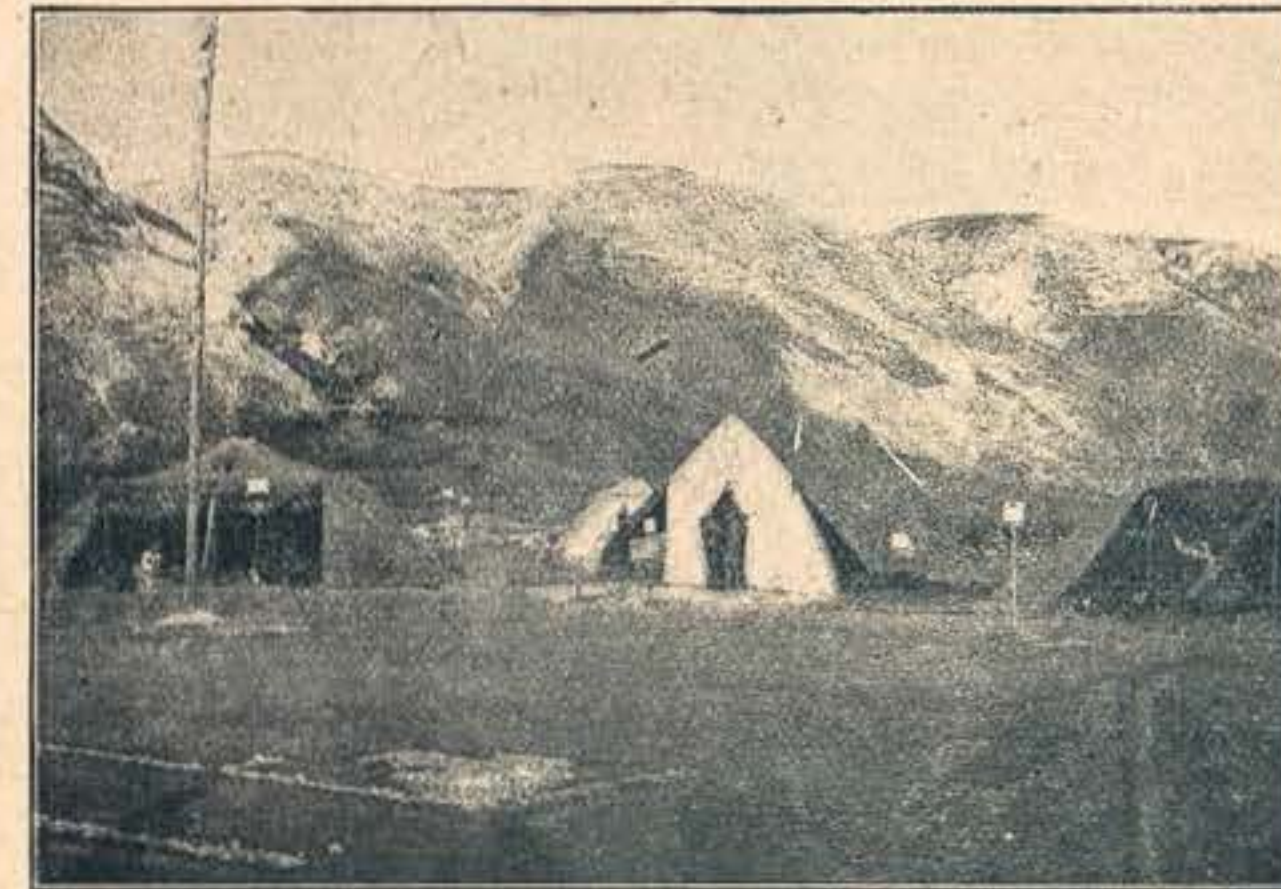
Obóz XI Poznańskiej nad Dniestrem pod Zaieszczykami.

a. Przy zapalnym obrzmieniu kończyn, obrzęk zaczyna się od dołu, jest on miernie