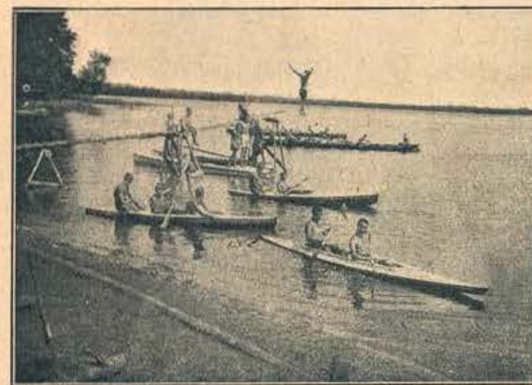
Ćwiczenia wodne na II Związkowym Kursie Wych. Fiz. nad Serwami.

Przy drużynie została zorganizowana Gromada Starszych