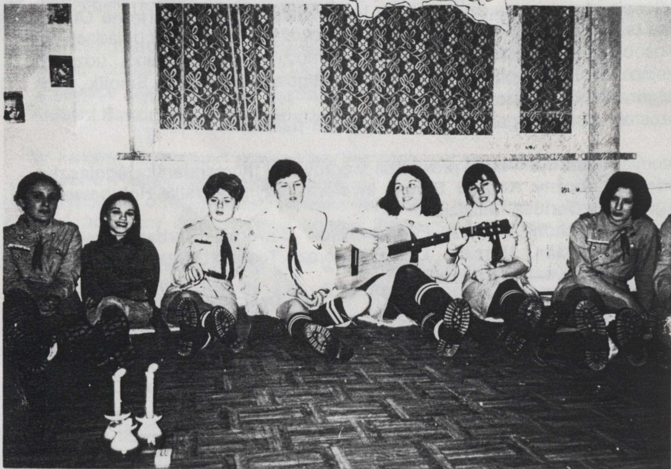
kominek z okazji Dnia Harcerza 97