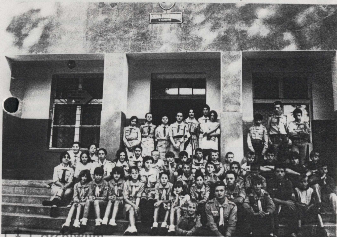
wędrownicy, harcerze i zuchy przed gościnną szkołą w Czaszyne