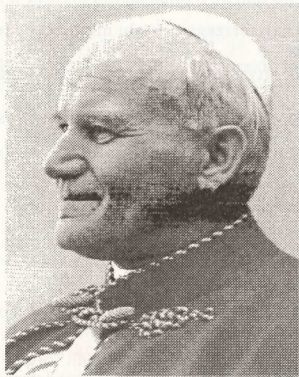
Joannes Paulus II

W dniu 19 marca 1994r. delegacja ZHR uczestniczyła we Mszy św. sprawowanej w intencji Jego Eminencji Ks.Bp. Józefa Glempa Prymasa Polski. Po złożeniu życzeń Ks. Prymas przekazał podziękowania dla całego ZHR. Księdzu Prymasowi zostały wręczone kwiaty i urodzinowy tort.