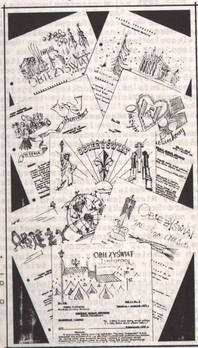
Strony tytułowe niektórych Obieżyświatów