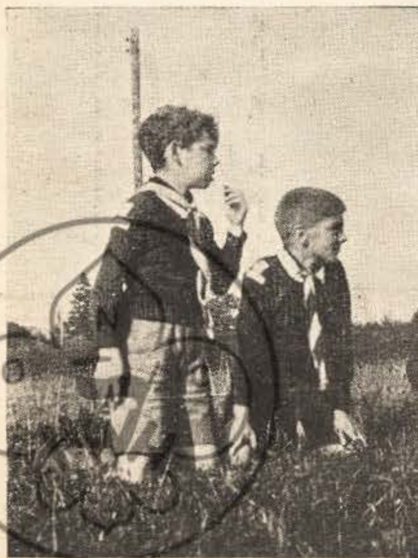
Wilczki w czasie gry.