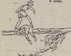
Rys. Wymijanie się przy przejściu przez kładkę

1. Przejście po kładce - jest to czynność z posoczu bardzo prosta. Jednak wymaga ona dużej uwagi i umiejętności zachowania równowagi. Kij akcentowy może posłużyć ci za pomoc - lub poręcz s liny.