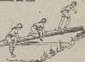
Rys. Wejście na belkę z siadu bokiem

2. Wymijanie się - przy przejściu ciału przez kładkę - na większej wysokości - jeden z drwiczających siada okrzakiem, wspierając się na kładce, lub kładzie się, jak na rys. a drugi przechodzi nad nim.