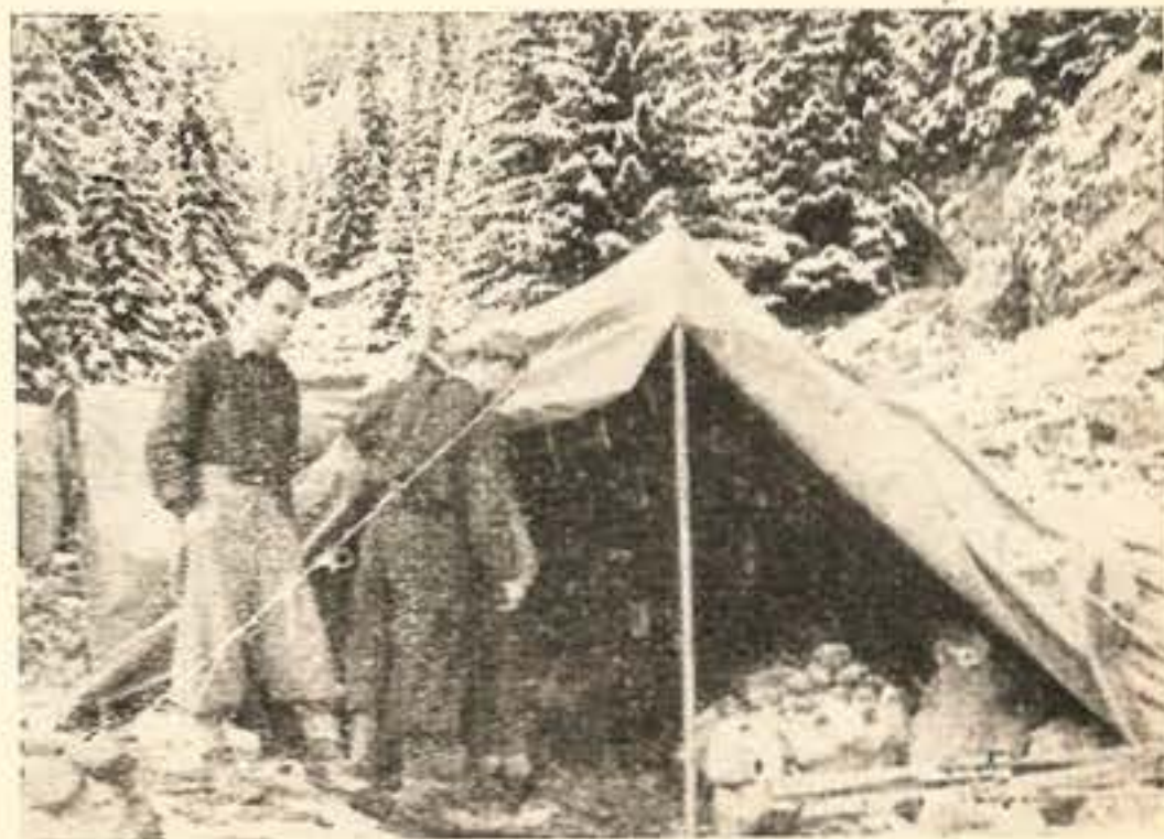
Nocleg w Chochołowskiej.

W czasie trwania zimowiska dobrze jest przeprowadzić dwu, trzy lub więcej — dniową wycieczkę z programem podobnym do programu wycieczek letnich, lecz na nartach.