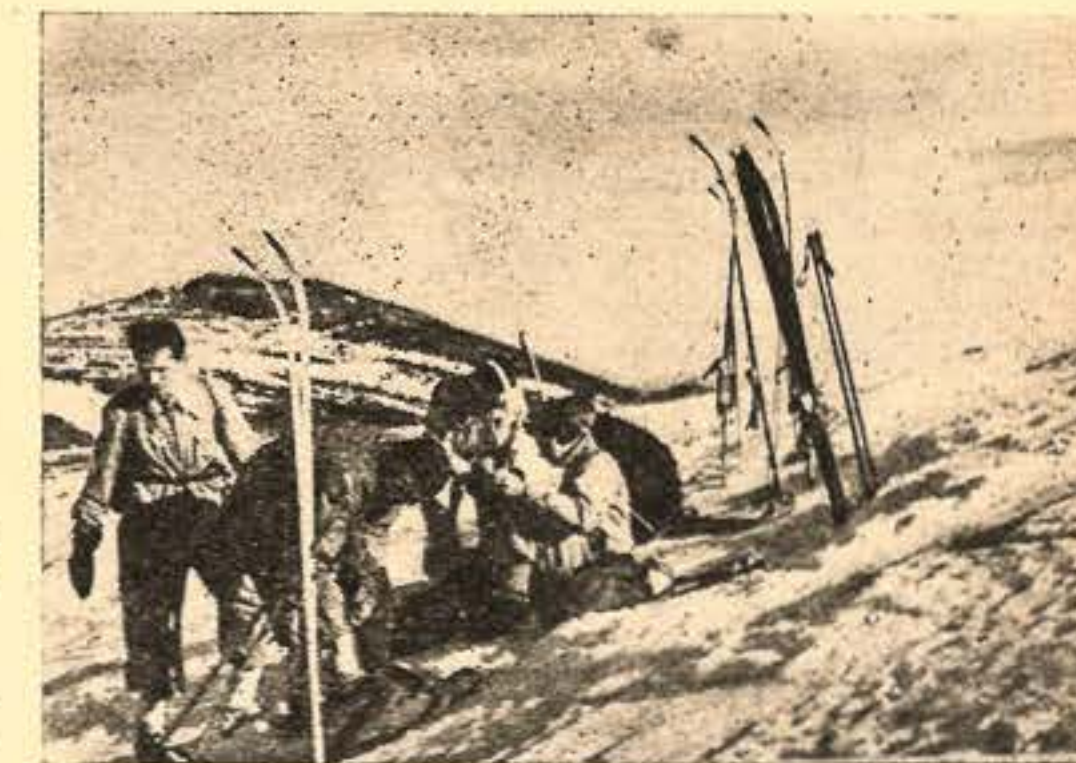
Na szpeli w Czarnochorze.

Artykuł niniejszy porusza piękną zagadnienie, gdyż zmusza drużynowych zwłaszcza zastępów starszych chłopców do wyraźnego jasnego przedstawienia aktualnego zagadnienia żydowskiego w świetle prawa i ideologii harcerskiej, niezłomnych zasad etyki Chrystusowej oraz potrzeb i ducha narodu polskiego (Przypisek Redakcji.)