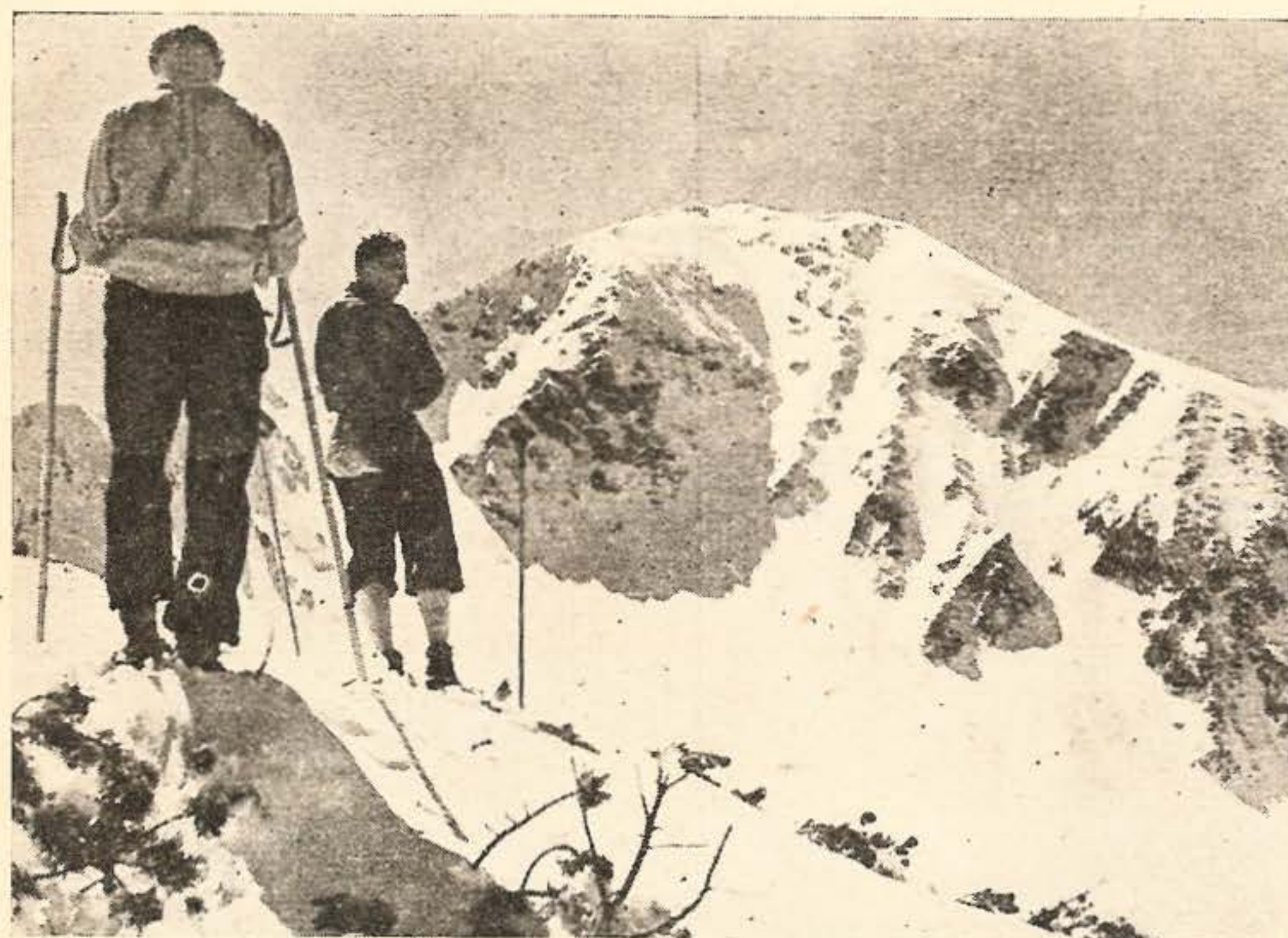
W obliczu piękna Tatr.