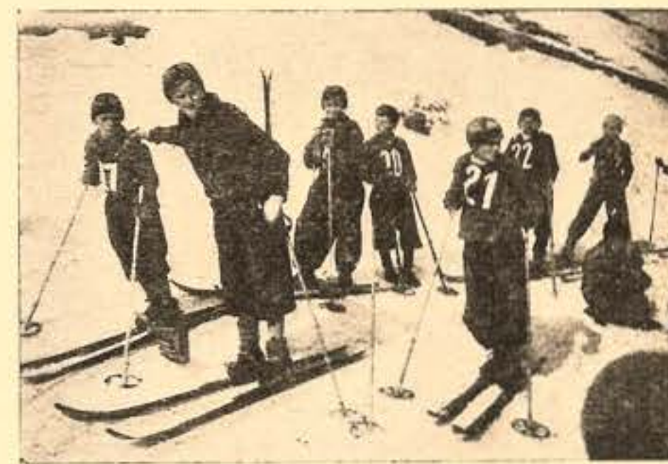
Gromady już rozpoczęły półkolonie i kolonie zimowe. Oto fragment zbiórki sportowca zimowego.

Wybrane powyżej przykłady potwierdzają moje słowa ze wstępu. A zamiast wyprowadzać wnioski z tej ankiety — powtórzę słowa, zawarte w jednej z wypowiedzi: