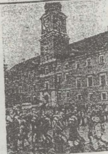
Harcerze na pl. Zamkowym

Także do naszej redakcji czerwoną różę przyniosli harcerki ze 104 Warszawskiej Drużyny Harcerki Starszych „Res Publica”. Dziękujemy.