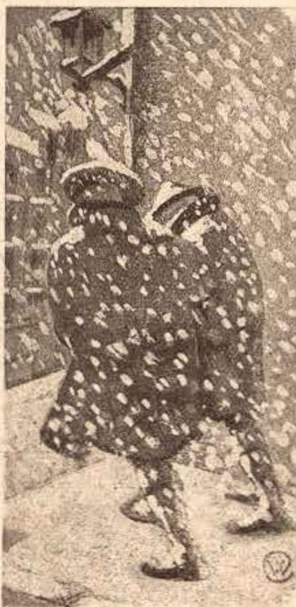
Wściekła wichura śnieżna pochwyliła w potężne swe spłoty Reda i Bala...

— Co ty mówisz o honorze? Ja się też na honorze znam!... — obraził się nieomal Korngold. (C. d. n.)