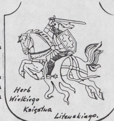
Herb Wielkiego Księstwa Litewskiego.

Dlatego do danego narodu może należeć w pełni także osoba, ezy grupa osób, oboe pochodzeniem, pod warunkiem jednak - że due chowu wiąże się ze środowiskiem owej zbiorowości, zwrasta się z życiem danego kraju i kieruje się dobrem wspólnym ealności. W Polsce - która dawniej miała b. wysoką osobowość duchową, Narodem Polskim czuli się - i słusznie - szlachetni Rusini, Litwini, Tatarzy, Ormianie, Żydzi, ezy Niemcy. My zaś mieliśmy ich za prawdziwych Polaków i braci - o ile tylko nie służyli zabobcom i