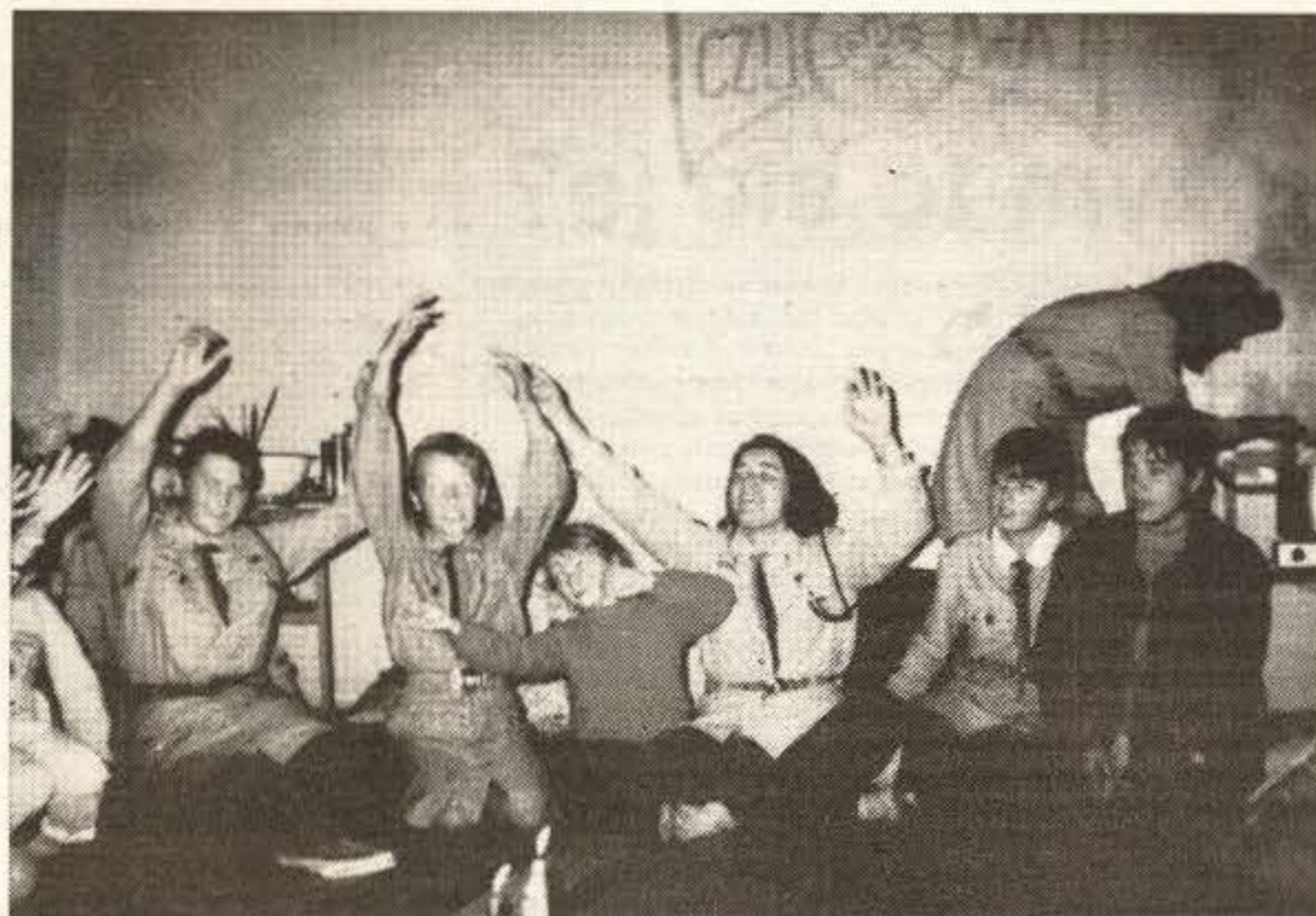
Podczas urodzin Turgielskiej Drużyny Harcerzek "Chinki".