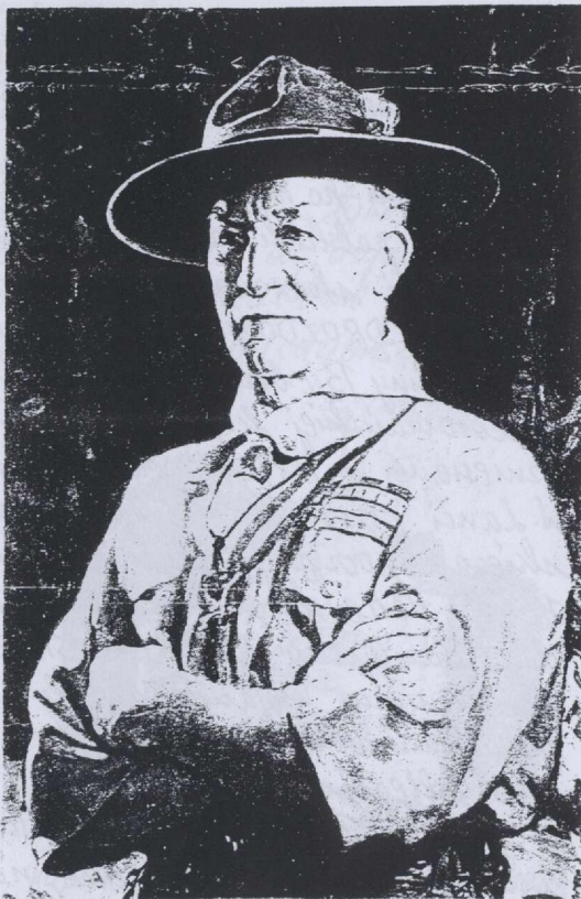
Robert Baden Powell – twórca ruchu skautowego urodzony 22.02.1857.