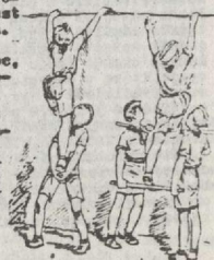
Rys. Włazenie na przeszkodę z pomocą