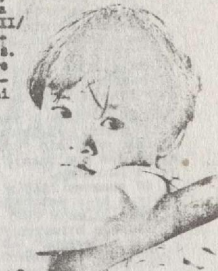
dosyć trzęsienia ziemi ludzi, posiadających dachu.