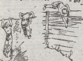
Rys. Zeskok z przeszkody

Haset bez kompasu - przychodzi nam z pomocą przyro-