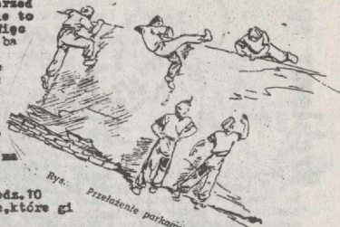
Rys. Przełazenie parkianki szacupem.

Deszcz - lub dłuższa niepogoda będzie, gdy: - s zachodu napływają szybkie chmury pierzaste, - chmury kłębiaste wznoszą się wysoko i mają kształt olbrzymich gór a wiatr jest mienawy,