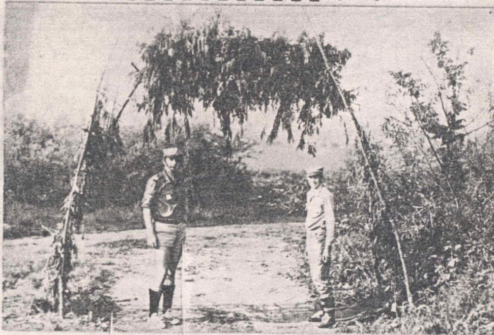
Złot chorągwi Pomorskiej RH - Lgd - maj 1989 Brama złotowa

JEDNODNIÓWKĘ, II ZŁOTU Północnej Chorągwi HARCERZY ZHP /r. z. 1918/ OPRACOWAŁ REFERAT PRASOWY ZŁOTU, 62 - 405 ŁĄD n. WARTA, WSD-TS.