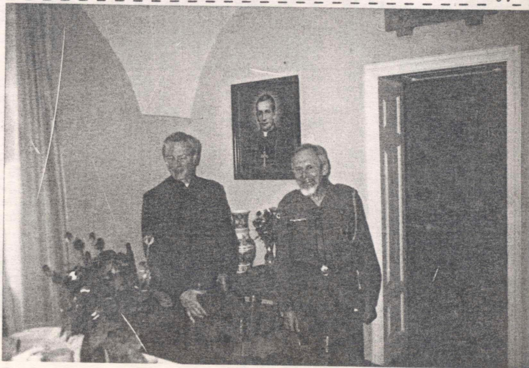
Złot w maju 1992 roku: Ksiądz Rektor gości Naczelnika Harcerzy ZHP /rok zał. 1918/