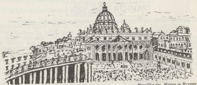
Bazylika św. Piotra w Rzymie

Miliony ludzi na całym świecie kochają papieża. Ale są i tacy, którzy się z nim nie zgadzają. Nie podoba im się to co papież głosi. Nawet zdarzyło się, że na audiencji ogólnej, dnia 13-go maja 1981 r. papież został postrzelony i bardzo ciężko ranny. Musiał długo leżeć w szpitalu po poważnych operacjach i dzięki łasce Bożej i modlitwom świata został uratowany. Mógł powrócić do dawnej pracy. A temu, który do niego strzelił od razu przebaczył. W grudniu 1983 r. odwiedził go w więzieniu!