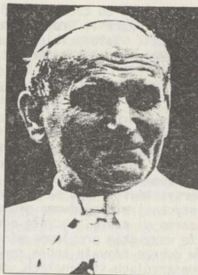
Papież Jan Paweł II