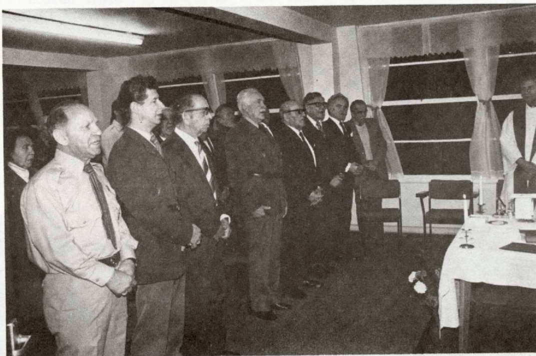
Uczestnicy Mszy Świętej.