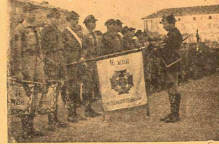
Podczas apelu spowito krepą sztandary drużyn.

Ale ustął rozgwar wojenny i żołnierz wrócił do domu. Marszałek rzuca nowe hasła, płynące z tego samego poczucia szlachetnie bojowej dumy i honoru narodowego, które manifestowały się przedtym w czynnej walce niewolników o wolność. Trzeba w pracy tworzyć taką potęgę